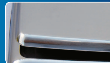
Obudowa i szalka ze stali nierdzewnej

Sprzedawane urządzenia mogą nieznacznie różnić się od prezentowanych na zdjęciach. Specyfikacja produktów może ulec zmianie bez powiadomienia. Folder nie stanowi oferty handlowej w rozumieniu Kodeksu Cywilnego.